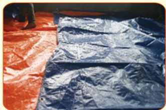
Đậy kín toàn bộ bề mặt bằng bạt