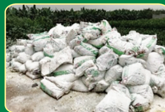
Tập kết phân lợn đến nơi xử lý