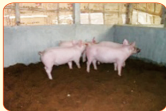
Nuôi lợn trên đệm lót sinh học