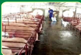
Thu gom phân lợn

Dùng CPSH phun/rắc lên phân vật nuôi trước khi ủ để rút ngắn thời gian ủ, giảm các chất độc hại, mầm bệnh, không gây ô nhiễm môi trường, tăng khả năng hấp thu của cây trồng.