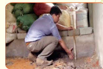
Chuẩn bị chuồng nuôi