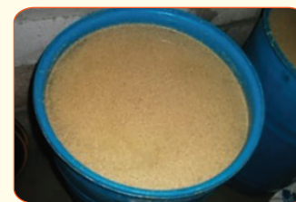
Chế dịch men

Cách chế dịch men: Theo hướng dẫn sử dụng của nhà sản xuất.