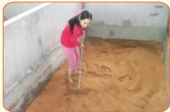
Rải nguyên liệu làm đệm lót