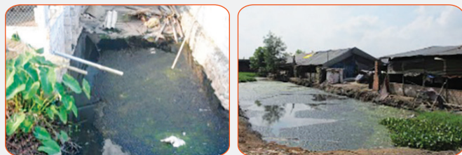
Nước thải chăn nuôi gây ô nhiễm

Nước thải chăn nuôi (gia súc, gia cầm) chứa các tác nhân gây bệnh như vi khuẩn, vi rút, ký sinh trùng, nấm... và có hàm lượng các chất hữu cơ cao, dễ phân hủy, gây mùi hôi thối và độc hại cho người và vật nuôi.