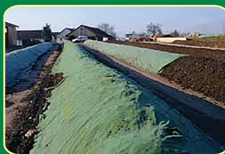
Dùng chế phẩm sinh học ủ phân vật nuôi