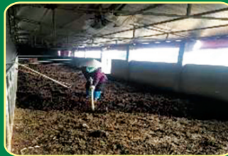
Bổ sung chất độn và chế phẩm men, đảo đều