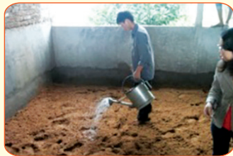
Tưới đều 1/2 dịch men