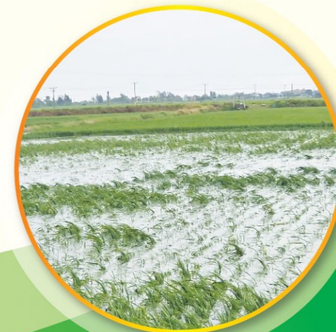
Nhiều diện tích lúa tại các tỉnh thành miền Bắc bị úng, ngập sau mưa bão, cần tập trung mọi nguồn lực bơm thoát, tiêu úng, không để ngập kéo dài, gây thiệt hại