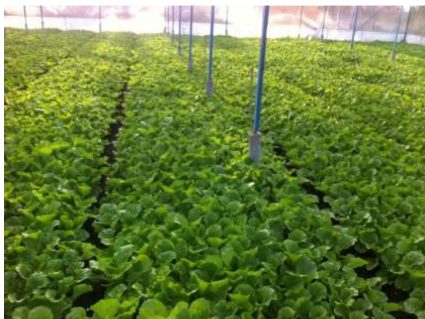
Sản xuất rau cải trái vụ trong nhà lưới tại Tam Dương, Vĩnh Phúc

Mặc dù vậy, số lượng mô hình, doanh nghiệp thành công trong lĩnh vực sản xuất nông nghiệp công nghệ cao trên địa bàn tỉnh còn khá khiêm tốn; doanh thu chưa thực sự ổn định, đáp ứng được nhu cầu tái đầu tư, mở rộng quy mô sản xuất.